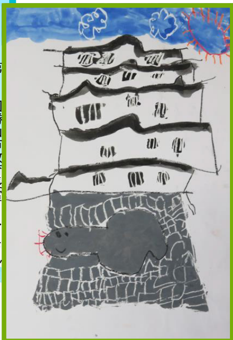
第18回勝山市教育長賞 K.Hさん