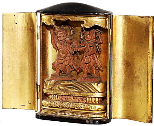
三宝荒神像 (大蓮寺所蔵)