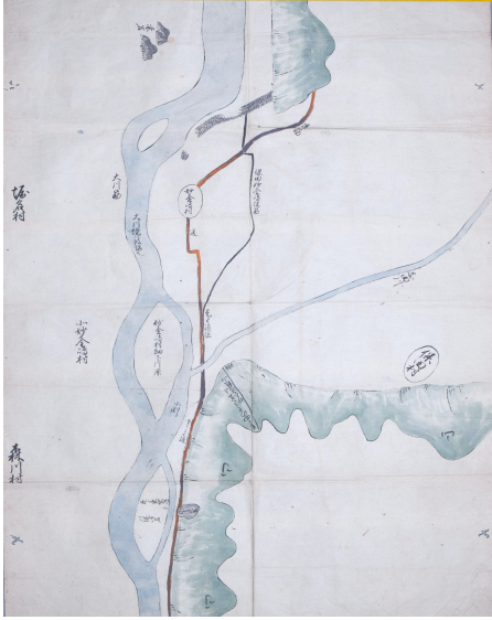
保田村・妙金島村境絵図 (個人蔵)

令和6年(2024)は、昭和29年(1954)に勝山市が誕生して70年の節目の年に当たります。また、勝山城博物館と勝山市の連携共催展も10回目を迎えました。今年、こうした2つの記念すべき年に当たりますが、さらには今をさかのぼること400年前の寛永元年(1624)、現在の勝山市の出発点ともなるべき松平直基の勝山藩が誕生しています。